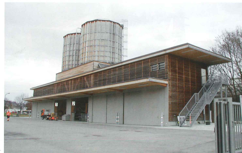
Salzlager in Winterthur-Töss mit einem Fassungsvermögen von total 800 m 3 Streusalz.

Nach Einsatzende wird das Fahrzeug gereinigt und wieder beladen. Da die Epoke-Salzstreuer als Wechselsystem unter Vollast abgestellt werden, stehen die Fahrzeuge nach dem Winterdienst wieder für die anderen Aufgaben zur Verfügung.